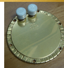
アルミ鋳込みヒーター